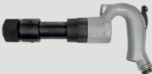
SW 2200QH Młotek pneumatyczny

Kup młot dłutujący SW 2200QH i zaoszczędź 15%!